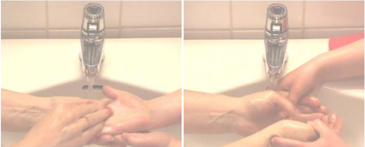
“Washing Me”, 4 min 5 sek (2008), video still