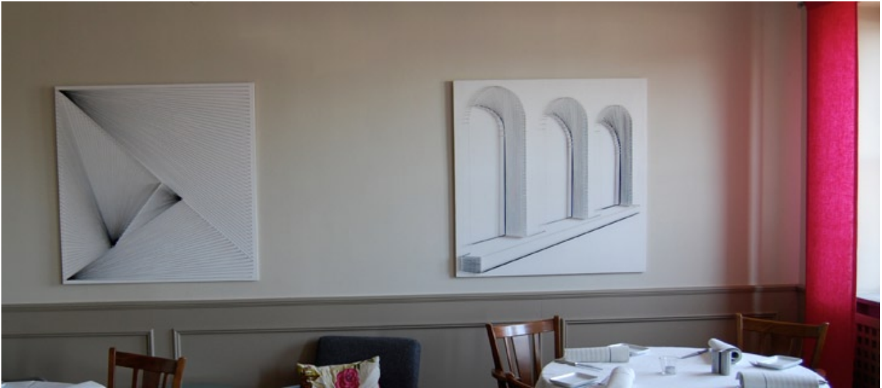
Lines II och Lines III, Restaurant Maritim, Simrishamn 2008