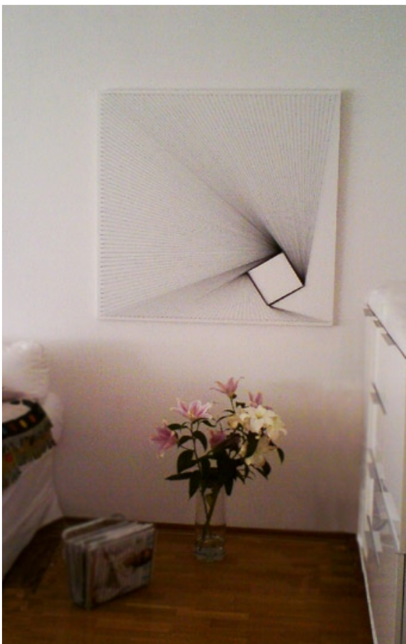
Lines IV, privat exponering, Stockholm 2012

- tredimensionella konstverk som skapar atmosfär i rummet.